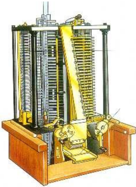
Macchina di Babbage